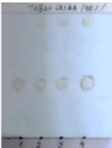
Figure 1. Thin layer chromatogram of Plantago Major L liquefy extract

Их таван салааны шингэн хандны нийлбэр флавоноидын чанарын шинжилгээний дүн: Их таван салаа ( Plantago Major L)-ны нийлбэр флавоноидын чанарын шинжилгээг тохиромжтой систем болох этилацетат-мөсөн цууны хүчил-ус (95:5:5), этилацетат-шоргоолжны хүчил-мөсөн цууны хүчил - ус (100:11:11:26) сонгон авч, стандарт бодисоор рутиныг ашиглан, НҮХ-ийг явууллаа. Хроматограммыг 3 % хөнгөн цагааны хлоридын спиртэн уусмалаар шүршиж харав.